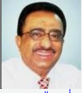
أحمد الحبشي مكافحة الإرهاب مهمة وطنية لا تراجع عنها