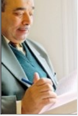
بقلم الشيخ الدكتور / احمد صبحي منصور بناء مجتمع المعرفة هو الفريضة الغائبة