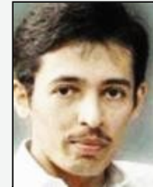
فارس بن حزام القيادات الخفية للإرهاب في السعودية