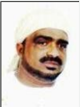
الشيخ / أنيس الحبشي حزب الشيطان !!