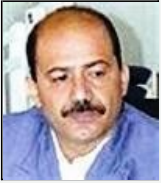
فصل الصوفي صمت القاعدة وراءه ما وراءه