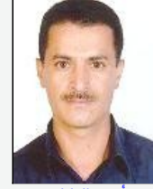
أمين الواتلي إلى "شوكة" في طريق الضالع!!