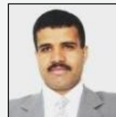
محمد جميع الأصولية الحوثية