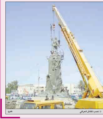
إزالة «المقاتل العراقي» لارتباطه بالحرب مع إيران

قال محللون ودبلوماسيون: إن السعودية تسعى لشراء نظام دفاع جوي روسي متطور بموازاة اقتراب الحار الإيراني الشيعي من الحصول على تقنيات سوية، يمكن أن تستخدم لغايات عسكرية. وأضافوا أن موسكو والرياح القريبة من إبرام الصفقة التي تبلغ قيمتها مليارات الدولارات، وتشمل مجموعة من الأسلحة يمكن أن تشمل نظام «إس 400» لتطوير