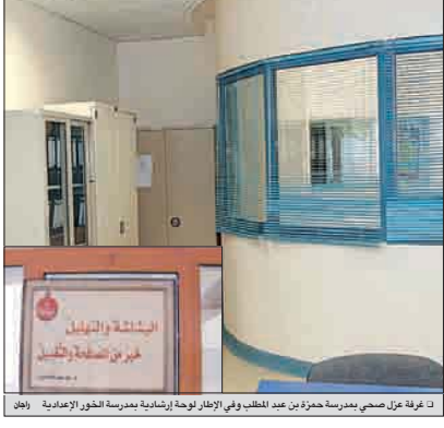
التي ما زالت تتخوف من الإنفلونزا

أكد مصدر مطلع بالمجلس الأعلى للتعليم أن جميع المدارس في قطر ستلتزم بالاشتراطات الصحية للدراسة في 2010، وذلك بعد أن تأجلت الدراسة لتسبب واحداً، حتى نتائج الفحص للدراسة في تونس والاشتراطات الصحية التي تضمن محاصرة الإنفلونزا الخنازير. وقال المصدر لـ«العربي» إن الحديث عن احتمال تأجيل بداية العام الدراسي لتسبب أضراراً لا يعود كونه مجرد أمني لبعض الأسر التي ما زالت تتخوف من الإنفلونزا. وأضاف المصدر أن المجلس لا يرى داعياً لتمديد التأجيل في ظل التزام المدارس بالاشتراطات والتجهيزات والاحتياطات اللازمة التي وجه المجلس الأعلى للصحة باتخاذها قبل انطلاق الدراسة إلى ذلك كشفت جولة «العربي» امس في عدد من المدارس عن التزام تام بتوجيهات المجلس من تجهيز غرف لتعزل المصابي، وتعيين ضباط الاتصال بالمدارس وتوقيع المعاهدات ونشر التوعية بالمرض، في حين عدم من المدارس اتجاه لغلق طوابق الصباح وإرشاد الطلاب لعدم التدنكس في الأماكن المغلقة.