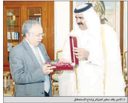
الأمير بلقاسم بن خليفة بن حمد آل ثاني

تلقى حضرة صاحب السمو الشيخ حمد بن خليفة آل ثاني أمير البلاد المفدى رسالة شفهية من فخامة الرئيس هوغو شافيز الجمهوري البوليفاريانا الفنزويلية تتصل بمحادثات الشعار بين البلدين والعلاقات ذات الأهمية المشتركة. واستقبل سمو الأمير امس سعادة السيد عيسى بكراي سفير الجمهورية الجزائرية الديمقراطية الشعبية الشقيقة بمناسبة انتهاء فترة عمله في البلاد. في بداية المقابلة منح سمو الأمير المفدى