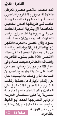
القطرية - القاهرة

قال معهد التمويل الدولي في تقرير: إنه من المتوقع أن تسجل اقتصادات دول الخليج العربية وفي مقدمتها قطر، نمواً قوياً في 2010، مستدركين أن بعض الشركات لا يزال بشكل خطورة. وأشار التقرير إلى أنه من المتوقع أن ينمو الناتج المحلي الإجمالي الفعلي في الكويت بنسبة 4%، وفي كل من السعودية والإمارات بنسبة 3.5%، وفي العراق بنسبة 3.4%، وفي الكويت بنسبة 1.9%، في الكويت وبنسبة 1.2% في السعودية وبنسبة 1.5% في الإمارات خلال 2009. وقال التقرير إنه من المتوقع أن يسجل الاقتصاد قطر نمواً بنسبة 35.5% العام القادم.